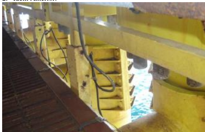
3. Fixação a frio de conectores com aplicação de Belzona®.