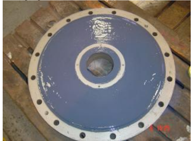
6. Tampa após revestimento com Belzona®1321.