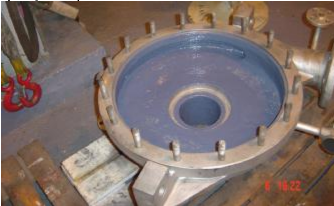
7. Serviço concluído após recuperação e revestimento com aplicação dos produtos Belzona®.