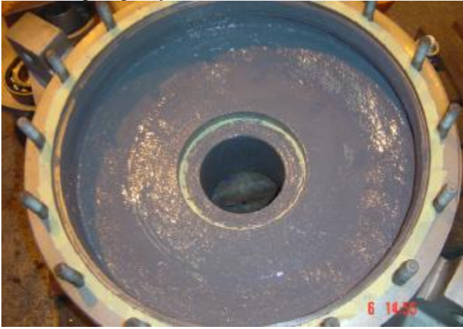
5. Voluta após aplicação do revestimento Belzoma®1321X